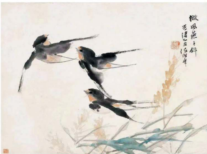
微风燕子斜 刘峰画于2023年