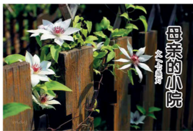
母亲的小院 文/王敬群

了长满绿植和开满鲜花的艺术品。母亲的花盆摆满了小院，大大小小，甚是好看。母亲像对待孩子一样精心养护着每一盆绿植。