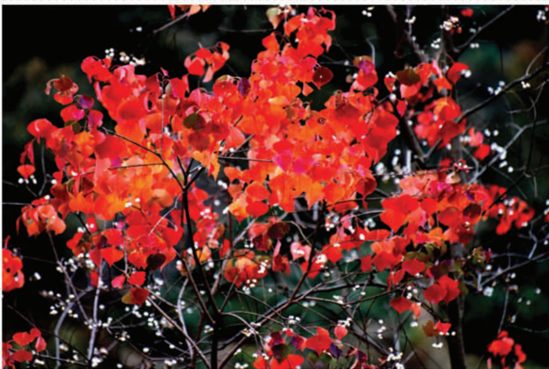
冬之色彩

古人云:“以财为草,以身为宝”。如果说于谦自喻为石灰,“要留清白在人间”,那么晏殊、吕夷简、范仲淹三位西溪的盐官便是晶莹剔透的盐,风范名垂青史。