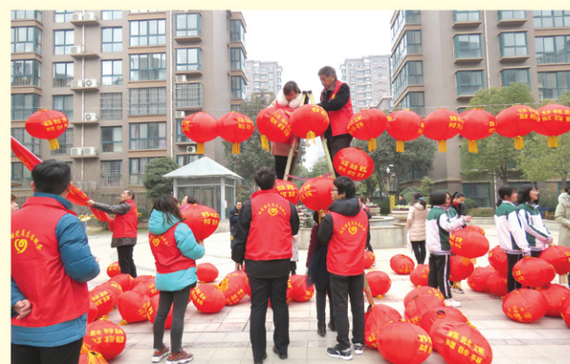
1月28日,金昌社区党支部、区政务服务中心党支部和上街实验高中党支部联合开展“党建带团建 大手拉小手 张灯结彩过新年”主题活动。党员带领团员和小志愿者们共同在小区廉政步道两侧、中心广场挂上大红灯笼,处处洋溢着节日的气氛。(通讯员 周爽)