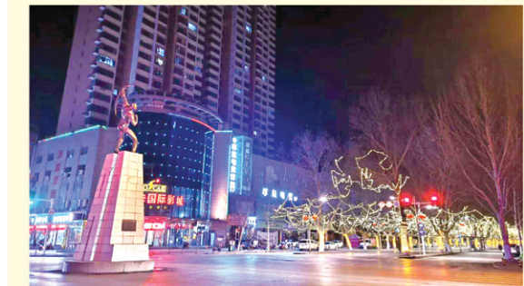
春节临近,我区各条道路张灯结彩,营造出浓浓的节日气氛。(通讯员 孙力 邢倩)