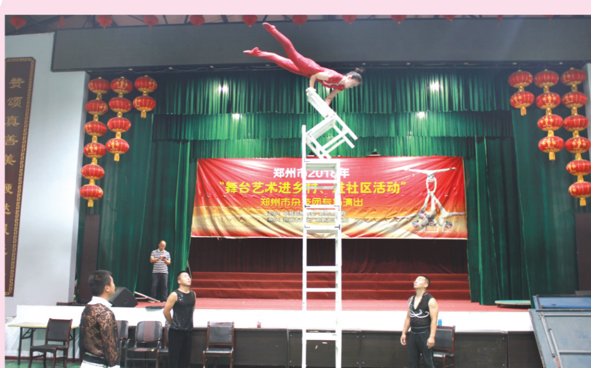
近日,郑州市文化惠民活动“舞台艺术进社区”走进朱寨社区,《水流星》《力量造型》《花盘》《晃圈》等该剧精品绝活、惊险刺激的表演让观众直呼过瘾。(通讯员 何静静)