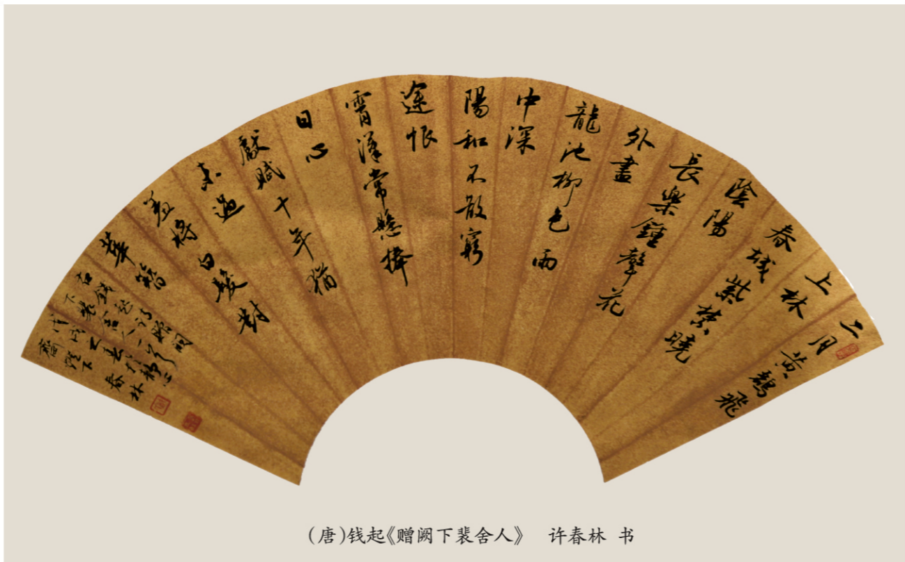
(唐)钱起《赠闾下裴舍人》 许春林书

“鸢飞蝶舞翩翩翻,远近随心一线牵。如此时光如此地,春风送你上青天。”让我们在这草长莺飞,风和日丽的春光里,去亲近自然,放飞风筝,放飞心情,放飞梦想。