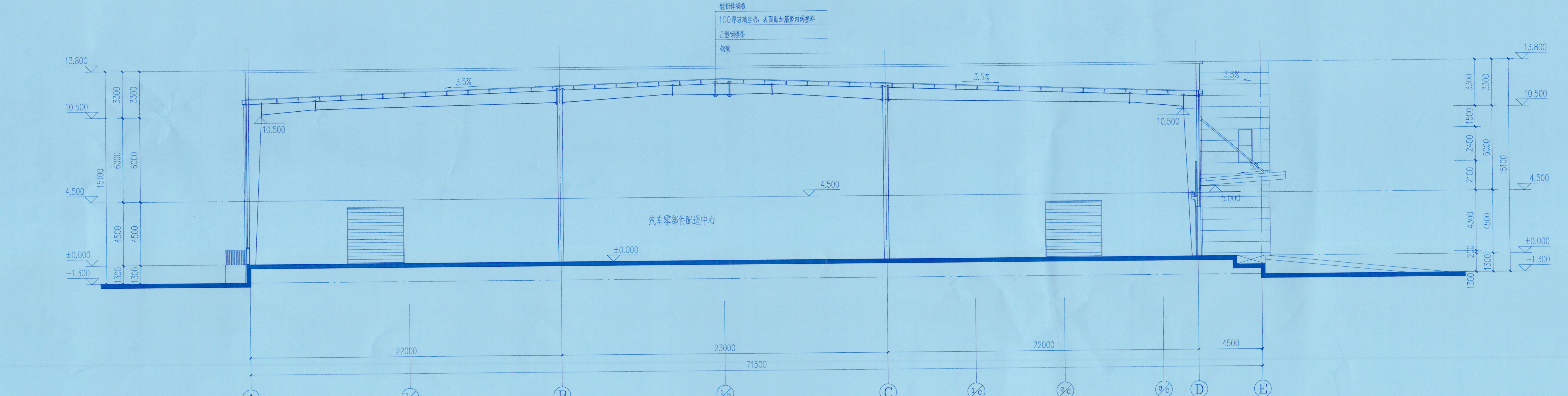
1-1 剖面图 1:200