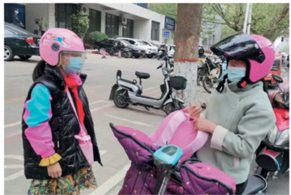
为进一步提升学生文明出行意识，有效预防和减少交通事故的发生，连日来，我区各学校举办形式多样的“小手拉大手 一盔一带我先行”主题宣传教育活动，倡导师生积极做文明交通的践行者、倡导者和传播者，为文明城市创建工作添砖加瓦。