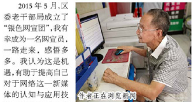
作者正在浏览新闻

2015年5月，区委老干部局成立了“银色网宣团”，我有幸成为一名网宣员，一路走来，感悟多多。我认为这是机遇，有助于提高自己对于网络这一新媒体的认知与应用技能。我建立了个人博客。五年来积极参与区委老干部局组织的各项主题“征文”活动，撰写相关稿件；平时，根据个人的所见所闻，所思所想，也即兴发稿。现已累计发表博文约八十篇。这些年来，在这个红色网络家园中，遵循“银色网宣团”“弘扬真善美，鞭挞假恶丑，传播好声音，增添正能量”的宗旨，尽心尽力，主动履行责任与担当，博文创作有了一定成效。同时，个人也从中受益良多，尤其得益于以文传情、以书会友之功效，丰富与充实了晚年精神生活。这正是： 网宣宗旨为根本，严格遵循要牢记； 履职当好网宣员，唱响时代主旋律。 新闻联播天天看，党报党刊常关注； 小道消息不可信，流言蜚语拒绝听。 网宣初心不能忘，尽职尽责担使命； 舆论导向最核心，弘扬传播正能量。