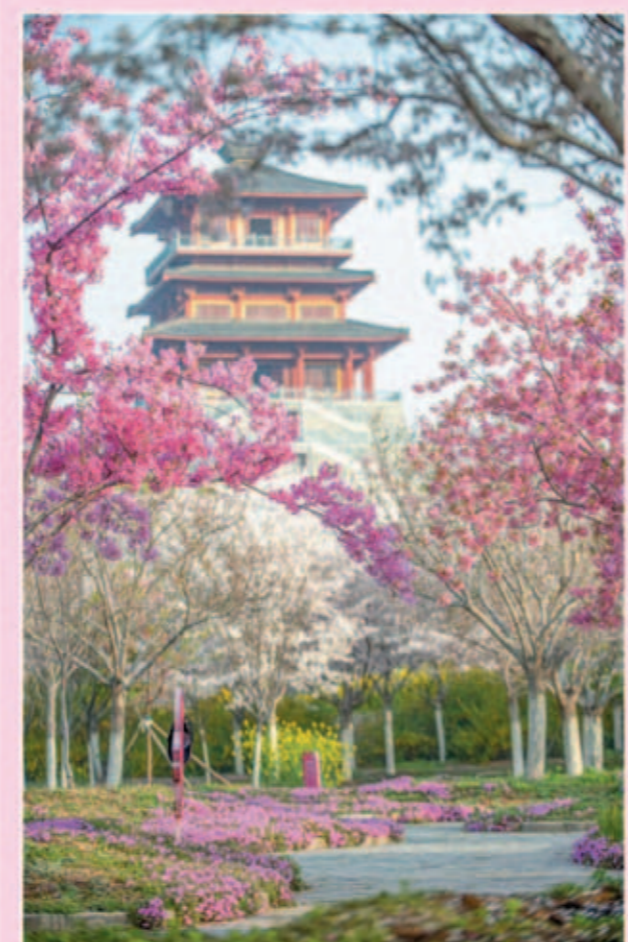
丰乐樱花园

她还喜欢种植花卉。例如这丛牡丹,她经常为牡丹浇水施肥。用霉变的花生米泡水,为牡丹花施肥。并挂上牌子:由老伴儿写上:“护花真可赞,损花最可耻!”。她特别爱护牡丹花。没有事情时,就经常来看护她的牡丹花。有顽皮的儿童,要来折花时,都被她善意的劝阻了。经常的进行管理。经常提着水桶来浇水。她收集厨房的下脚料,经过发酵后,为这丛牡丹施肥。这丛牡丹在她的精心护理下,长得棵大枝粗叶肥,特别旺盛。这真是辛勤的汗水,浇出鲜艳的大牡丹!