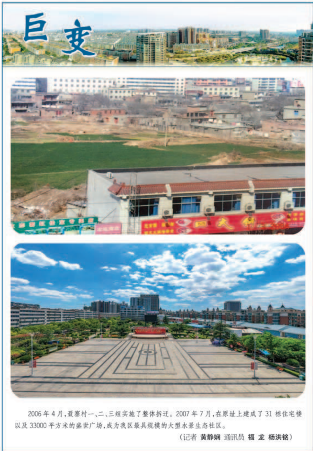
2006年4月,聂寨村一、二、三组实施了整体拆迁。2007年7月,在原址上建成了31栋住宅楼以及33000平方米的盛世广场,成为我区最具规模的大型水景生态社区。