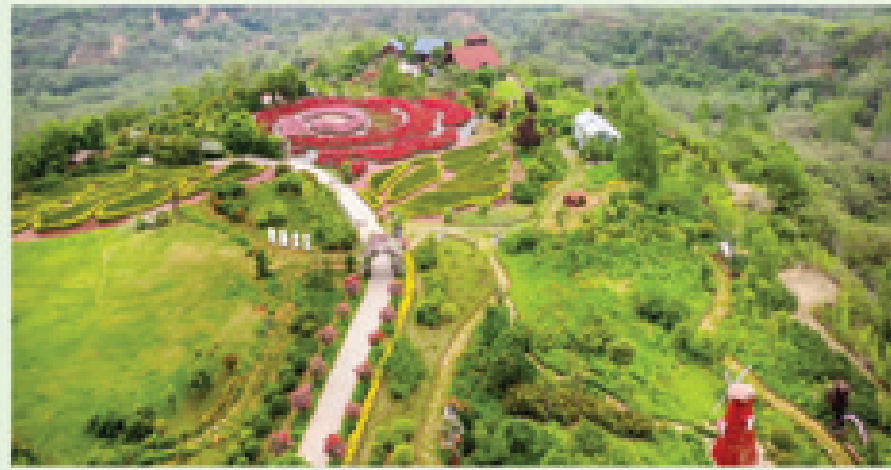
五云山风光